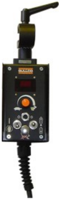
リモートコントロールキット 型式: GSP-2013