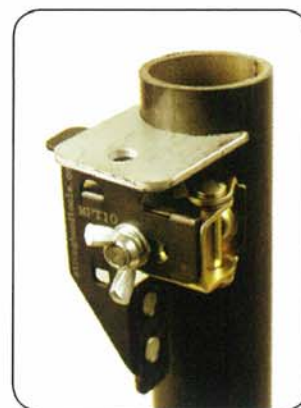
垂直タブの仮付け