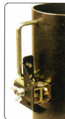
ハンドルの仮付け