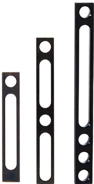
T60505 T60510 T60517